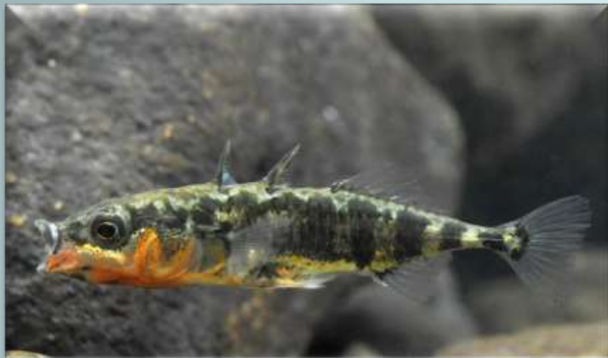
Трёхиглая колюшка (Gasterosteus Aculeatus)