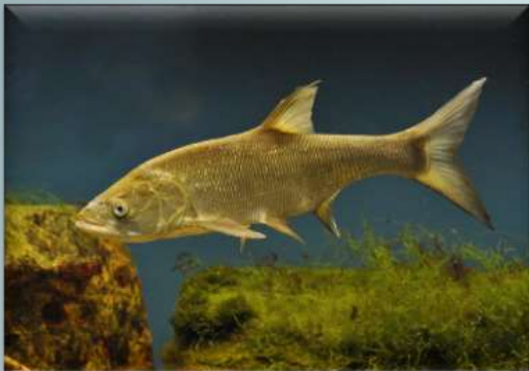
Жерех ( Leuciscus aspius )