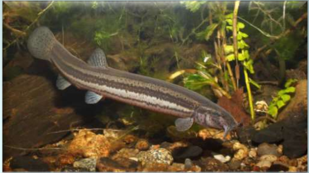
Вьюн (Misgurnus fossilis)