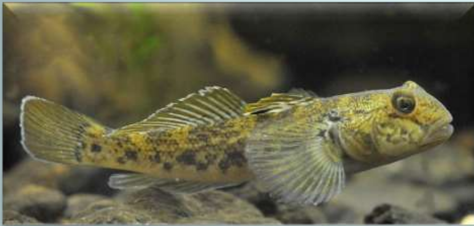
Бычок-кругляк ( Neogobius melanostomus )