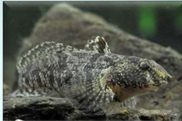
Бычок-цуцик ( Proterorhinus marmoratus )