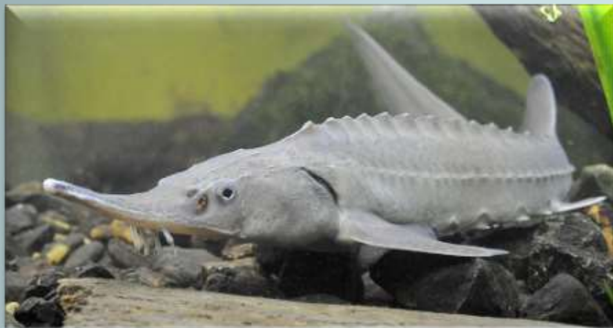
Сибирский осётр ( Acipenser baeri )