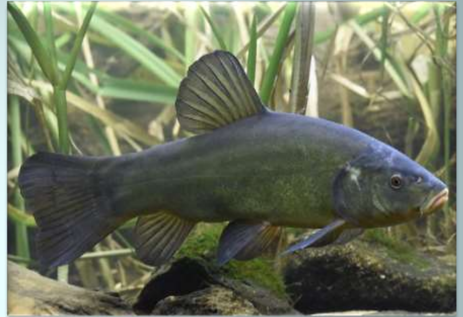
Линь ( Tinca tinca )