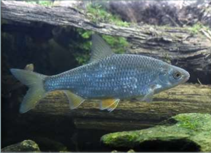
Плотва (Rutilus rutilus)