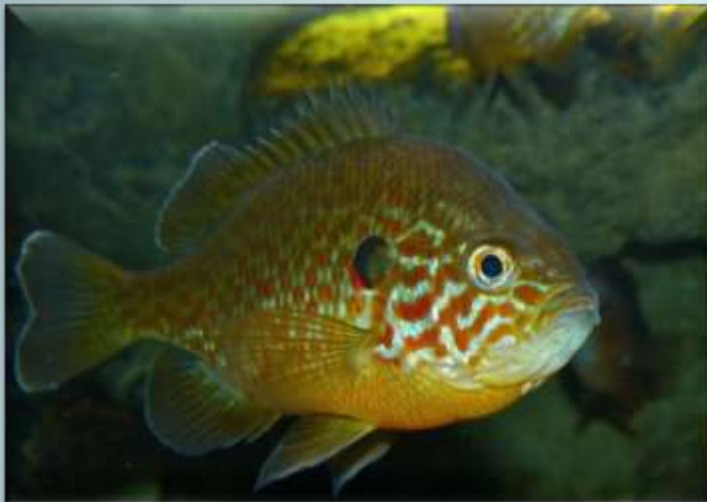
Солнечный окунь ( Lepomis gibbosus )