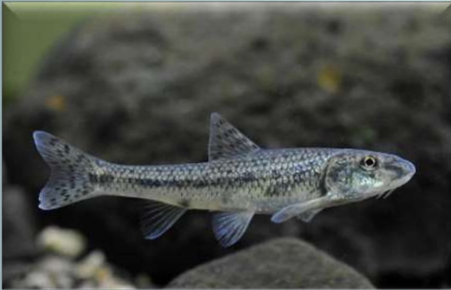
Пескарь (Gobio gobio)