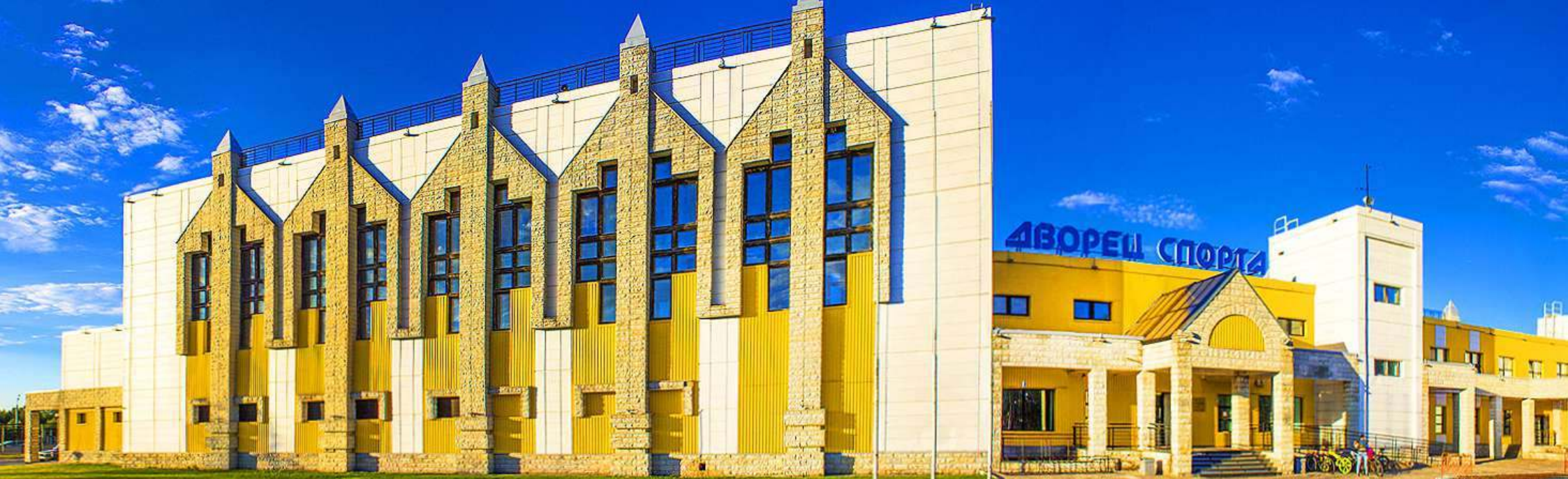
СК «ДВОРЕЦ СПОРТА»