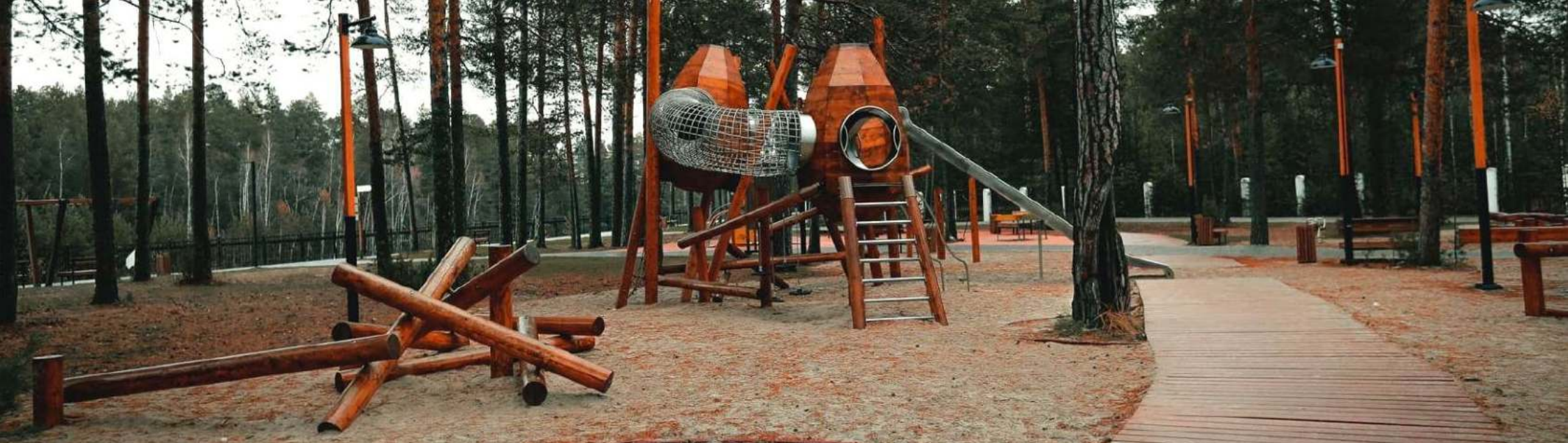
ПАРК НА НАБЕРЕЖНОЙ РЕКИ ИНГУ-ЯГУН