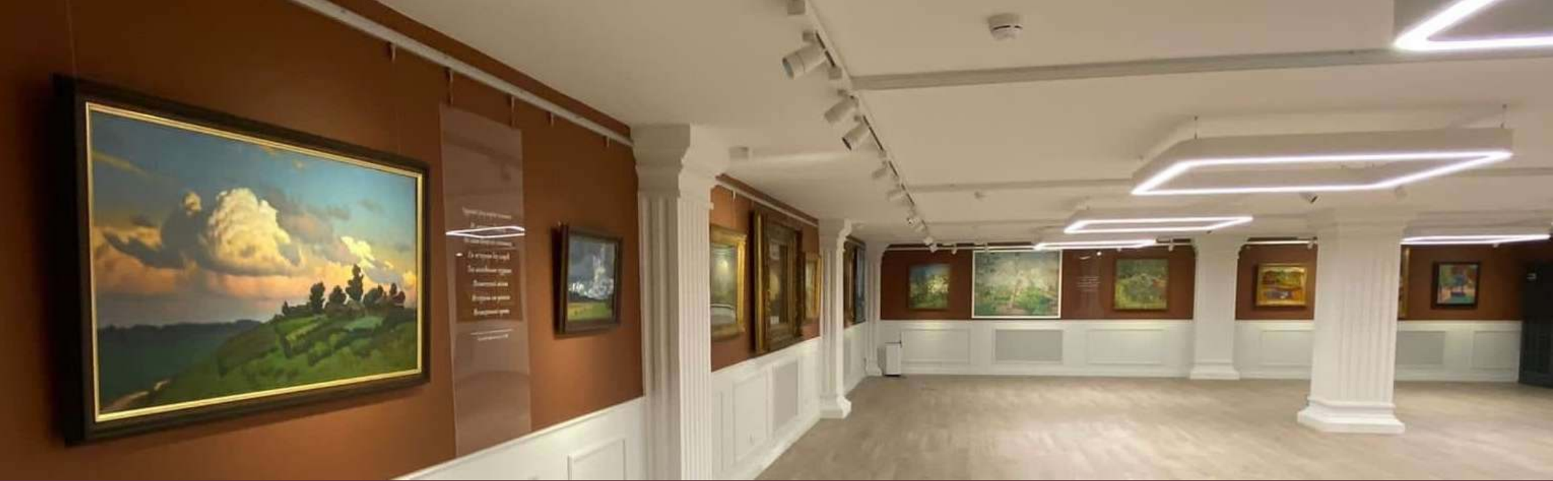
КУЛЬТУРНО-ВЫСТАВОЧНЫЙ ЦЕНТР РУССКОГО МУЗЕЯ