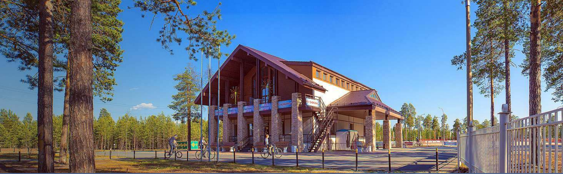
ЛЫЖНАЯ БАЗА «СНЕЖИНКА»