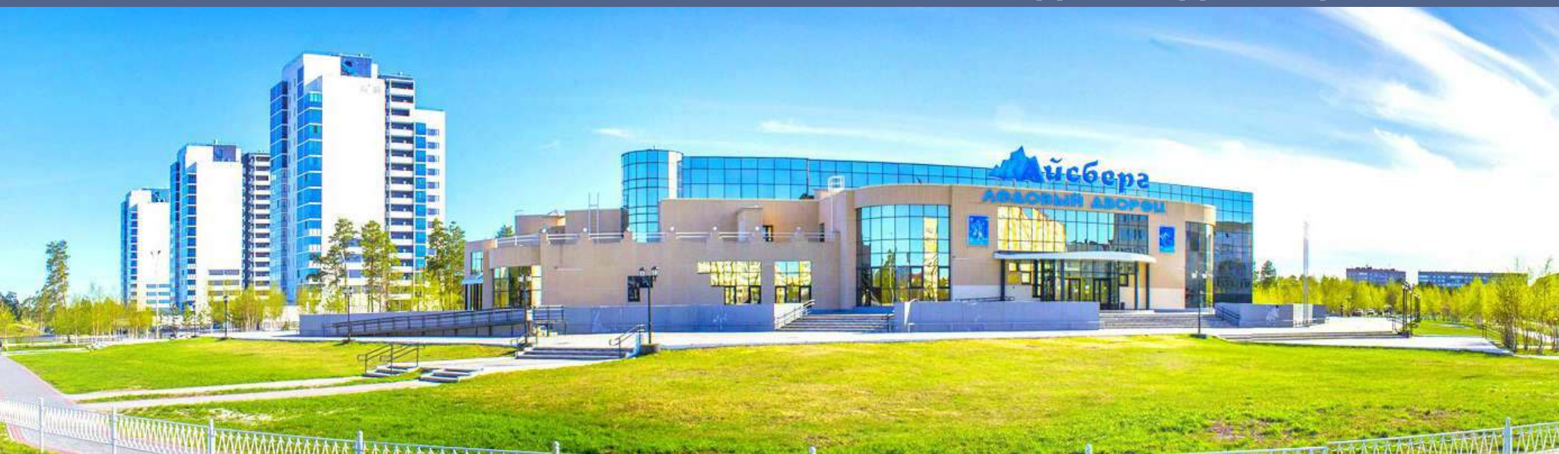
ЛЕДОВЫЙ ДВОРЕЦ «АЙСБЕРГ»